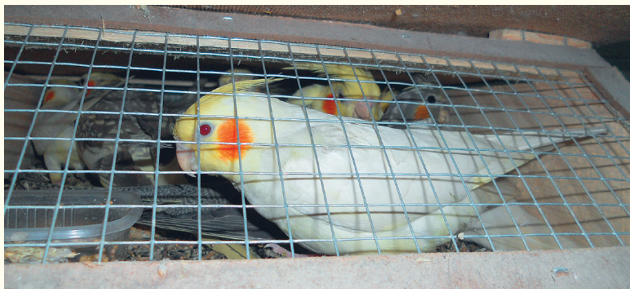
През декември митнически служители от МП Капитан Андреево задържаха 1805 папагала, между които 55 от защитения вид „Розели“.

● активно участие в подкомитети към Съвместната комисиия за създаване на организация за прилагане на Споразумението между правителствата на Република България и на Съединените американски щати за сътрудничество в областта на отбраната, в работна група за промяна на Рамковото споразумение между Република България и Европейската банка за възстановяване и развитие относно дейностите на Международния фонд „Козлодуй“, в междуправителствена работна група „Хранителни банки“ под ръководството на министъра на земеделието и храните за изясняване възможностите и ограниченията при развитие на модела за хранително подпомагане в Република България, в междуправителствените работни групи относно промяна на