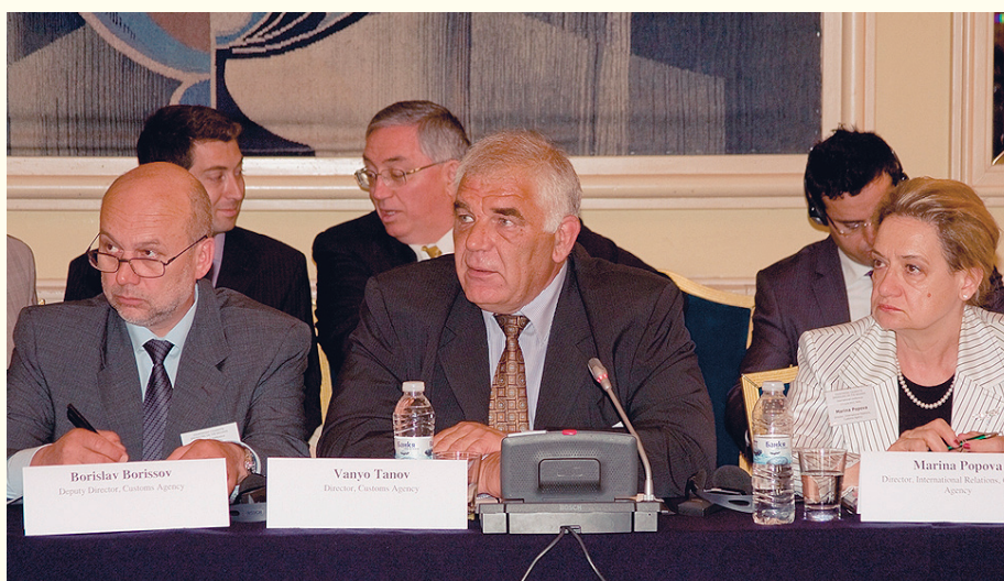
Международната конференция по противодействието на контрабандата на цигари на Балканите предизвика голям интерес.

вени пред повишен натиск от контрабанда на цигари във всичките ѝ форми. В тази връзка на 2 юни в София бе проведена международна конференция на тема „Противодействие на контрабандата на цигари на Балканите“, организирана от Центъра за изследване на демокрацията и Агенция „Митници“. В конференцията участваха висши служители на Министерството на финансите и на МВР, генералните директори и висши служители на митническите администрации на България, Турция, Гърция, Ма-